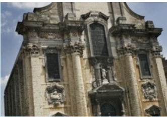
Een van de gaafste en meest authentieke barokkerken